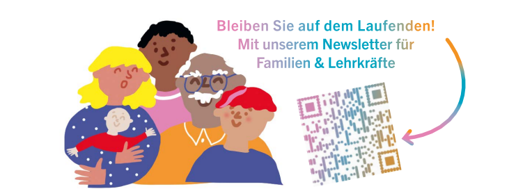
Eine Kooperation des Theater Bonn mit der Deutschen Oper am Rhein Düsseldorf Duisburg, dem Theater Dortmund und der Theater und Philharmonie Essen GmbH im Rahmen der Reihe Junge Opern Rhein-Ruhr.

TECHNIKSHOW Opernhaus 10+ Anmeldung über portal@bonn.de; nur im Schulklassenabo 14.3.25 um 10 Uhr Schulvorstellung Was für Berufe gibt es am Theater? Was für Ausbildungsplätze? Und wie arbeiten eigentlich so viele unterschiedliche Menschen zusammen? Exklusiv für Schulklassen präsentieren wir im Rahmen der Techniksow im Bühnenbild von Liebestrank nicht nur die Technik, sondern auch die Menschen dahinter. Für jede Produktion wird die Bühne komplett neu eingerichtet und für jede Vorstellung zahlreiche Menschen backstage benötigt.